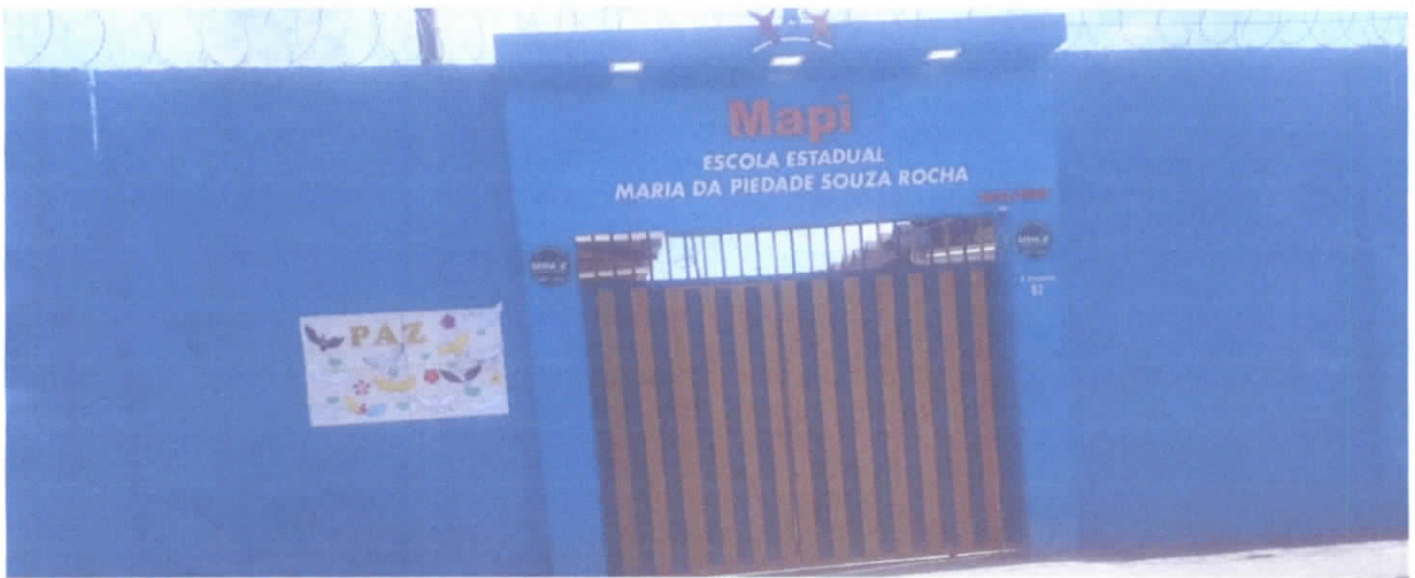
ESCOLA ESTADUAL MARIA DA PIEDADE SOUZA ROCHA