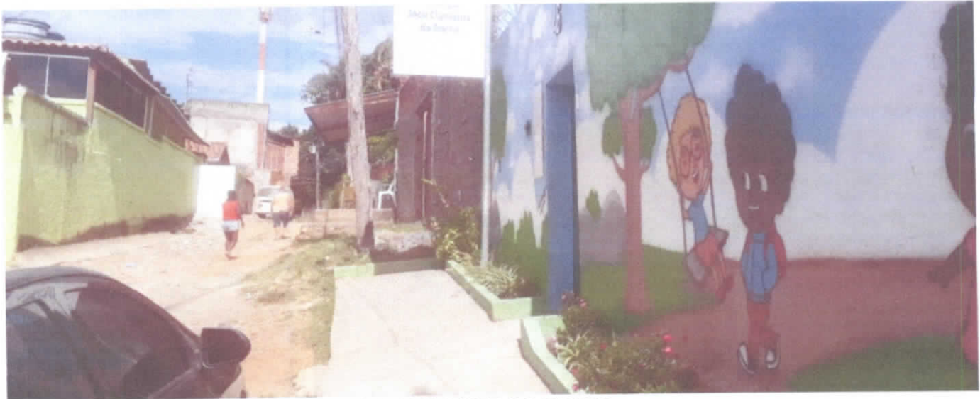
ESCOLA MUNICIPAL JACIR CLEMENTE DA ROCHA