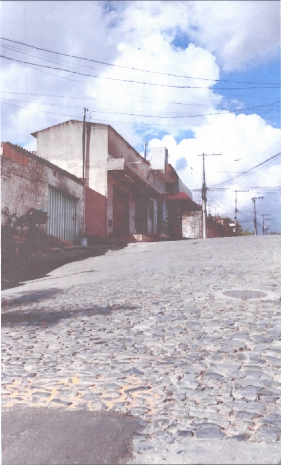
Rua Colômbia, conjunto Henrique Saporì.