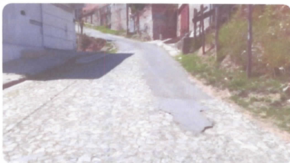
Rua São tarcisio bairro maria Helena